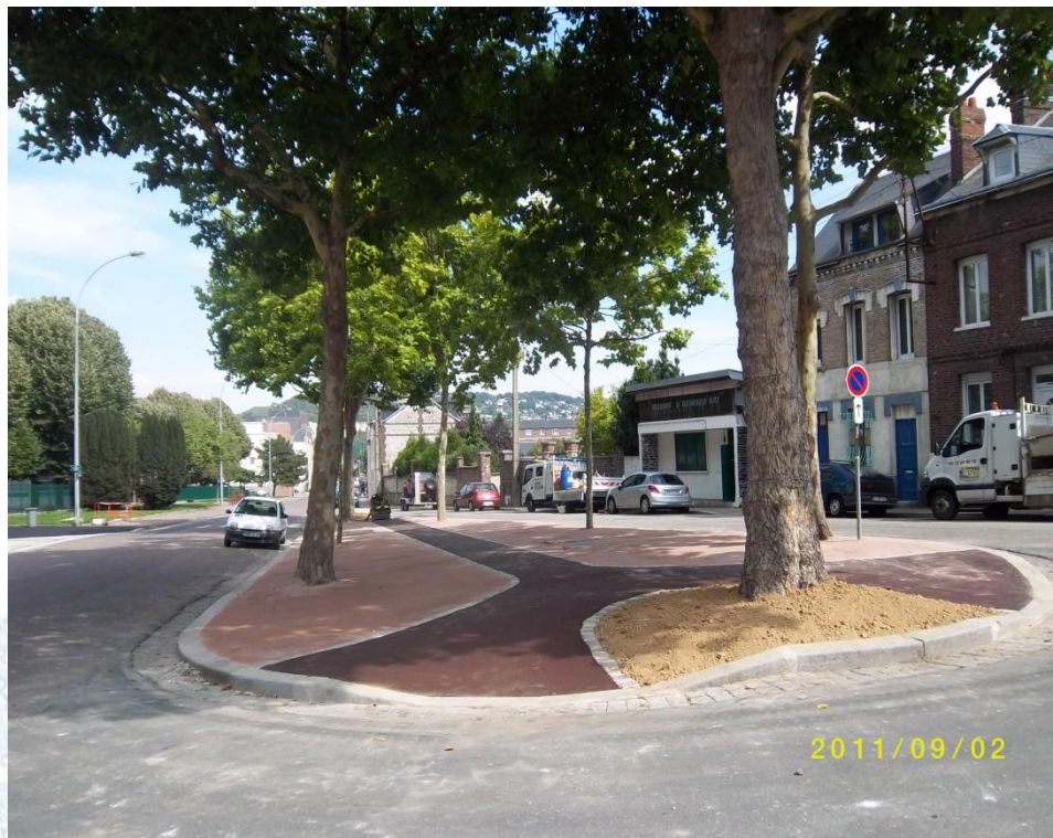
Rue du Cours (2011)