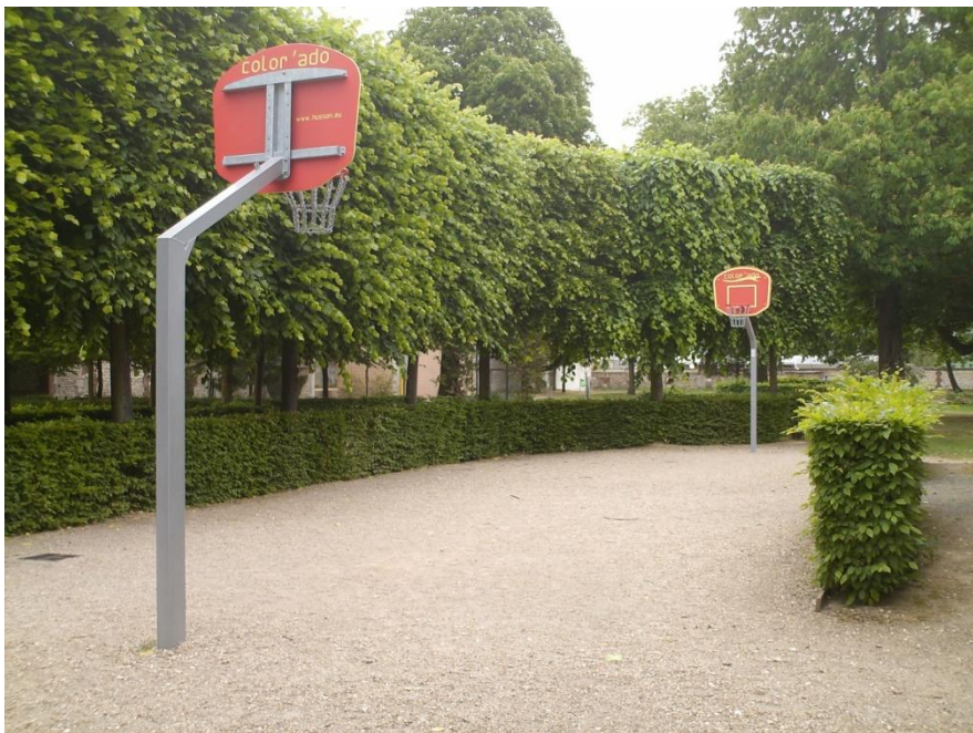
Jardin St Sever (2010)