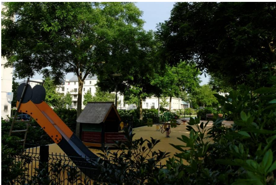
Agrandissement de l'aire de jeux, Parc de la Madeleine (2009)