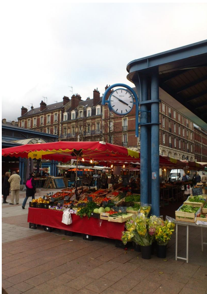
Les horloges, Place St Marc (2012)