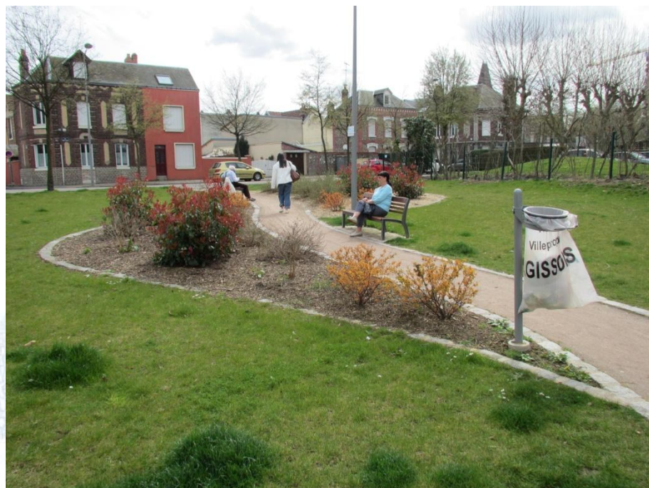
Rue Parmentier/rue St Julien (2010)