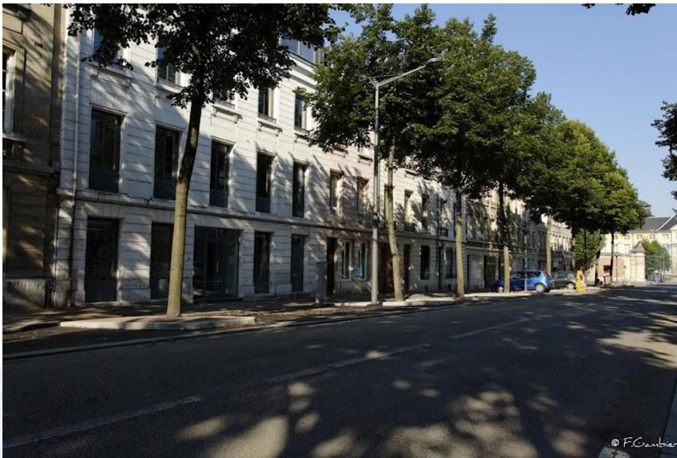
Avenue Gustave FLAUBERT (2011/2012)