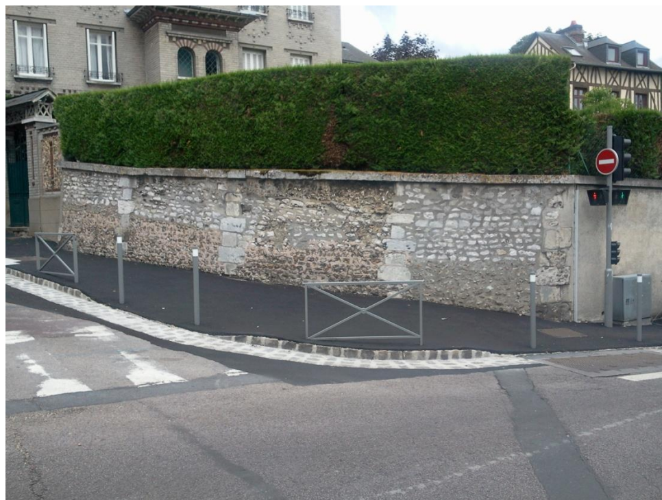
Aménagement du carrefour rue du Champ des Oiseaux/rue Ricarville (2012)