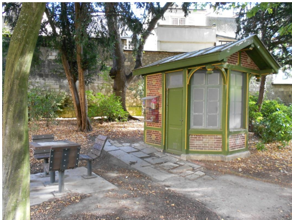
Jardin de l'Hôtel de Ville (2010)