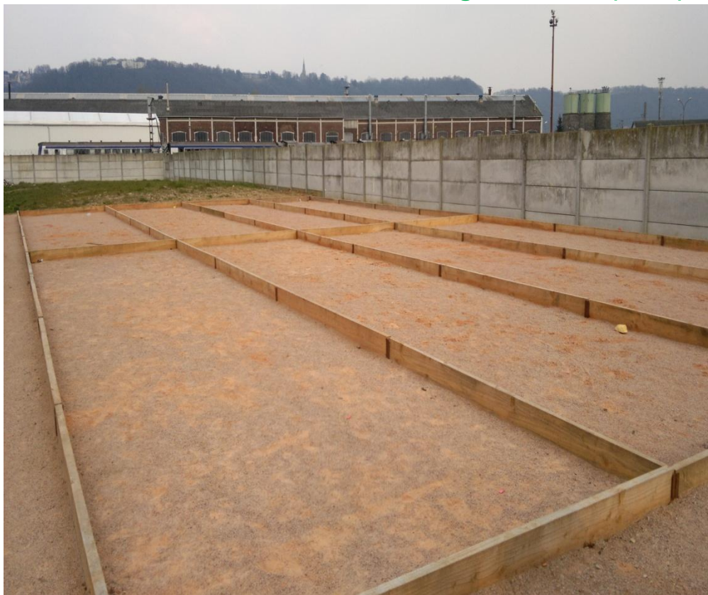
Création d'un bouldrome, rue Roger BAUDU (2012)