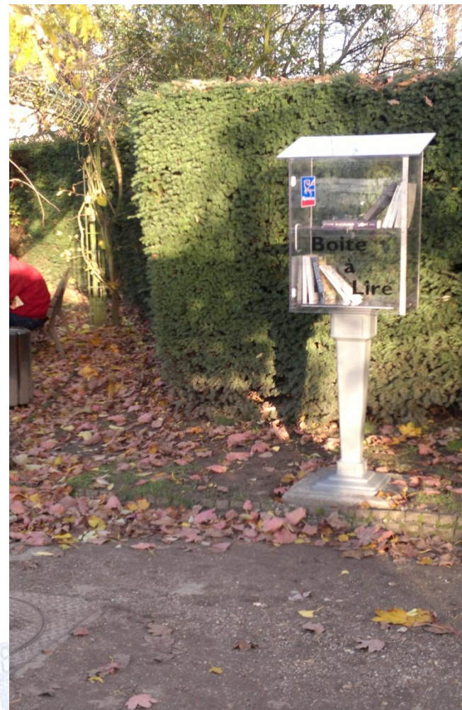
Jardin des Plantes (2012)