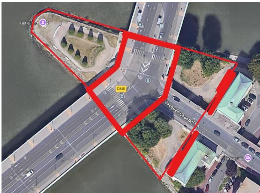
Périmètre d'intervention y compris dalle (sous le pont) et des escaliers venant de Chastelain

La mission comprendra le vidage des corbeilles, le nettoyage des graffitis sous le pont (hors pile du pont), le nettoyage haute-pressure de la dalle sous le pont, de l'escalier venant de Chastelain, le piquage propreté hebdomadaire sur l'ensemble du site et le passage d'un engin de nettoyage tous les 15 jours.