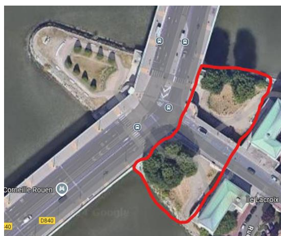
Périmètre Espaces Verts de la Pointe Aval + Perimetre élagage